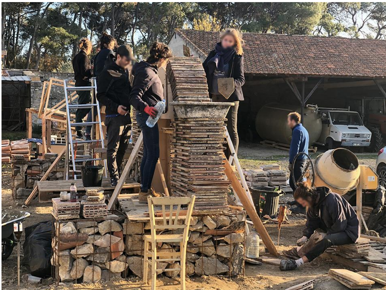
Figure 7 : Construction d'un pavillon en ré-emploi au mas de Mirabeau, Fabrègues (34), 2019.

comme la permaculture ou l'agroécologie qui s'opposent au modèle hérité d'après-guerre (industrialisation de l'agriculture, pratiques intensives avec entrants, encore soutenu majoritairement par la PAC et les chambres d'agriculture) a constitué pour nous un référent. Des structures comme « l'atelier paysan » 14 ré-interrogent les outils dans le but d'une souveraineté technique, à travers l'auto-construction de bâtis et de machines agricoles, condition nécessaire pour des pratiques, aujourd'hui en dé-connexion. Les étudiants re-situent leur discipline et leur pratique à travers ce qui la fonde : l'acte de bâtir, dans sa matérialité, ses techniques et l'organisation du travail qui le porte.