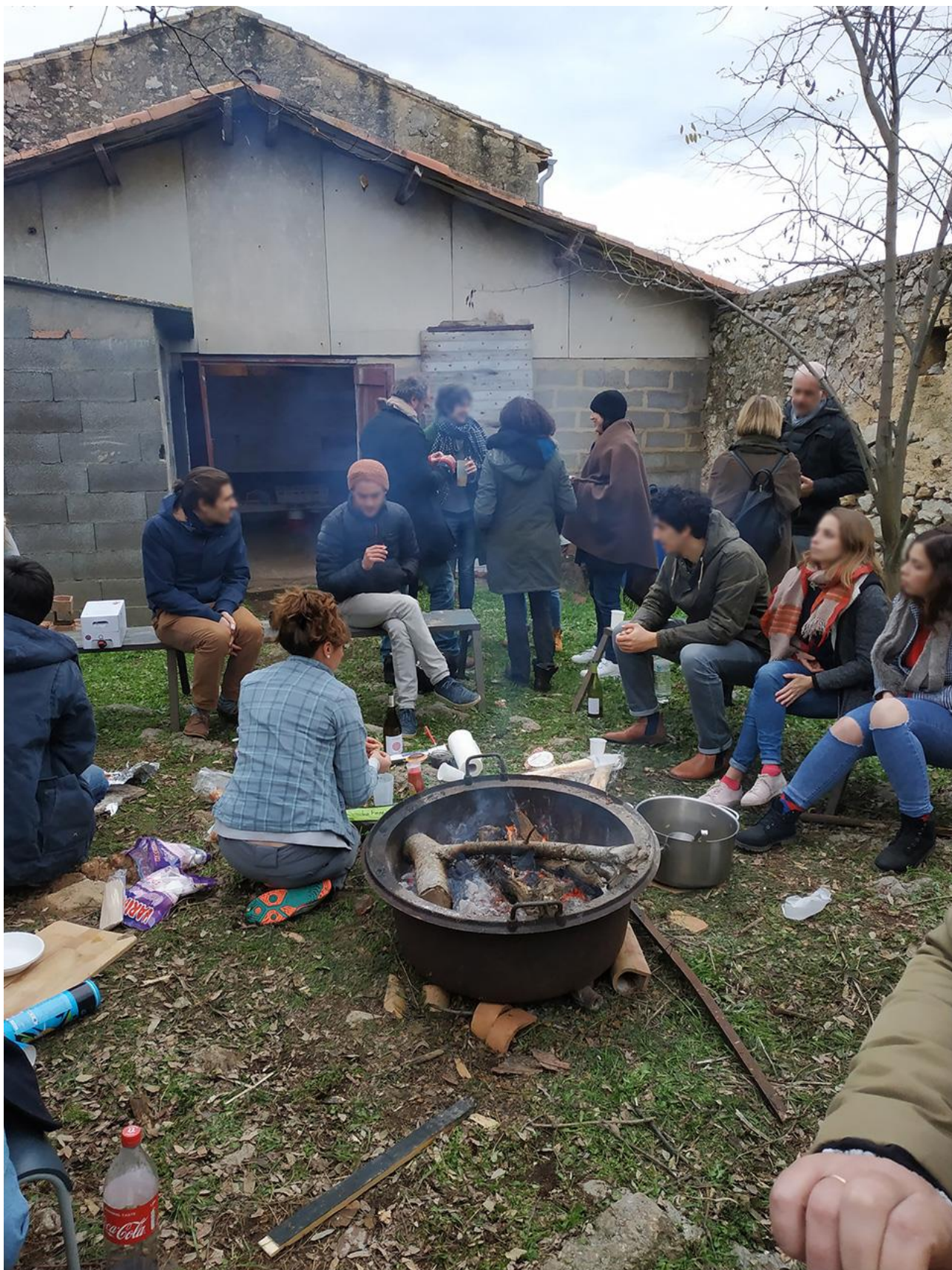
Figure 3 : Installation au Mas de Mirabeau, Fabrègues (34), 2018.

Atelier Hors les murs - Domaine d'études Situation-s à l'ENSA Montpellier.