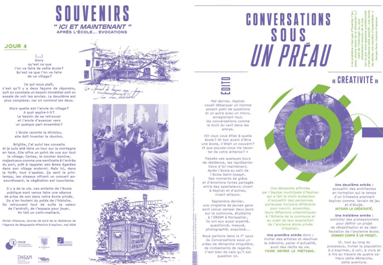
Figure 4 : Extrait du journal réalisé par l'Atelline.

Journal de bord de la résidence de l'Agence de Géographie affective à Aspiran, mai 2018.