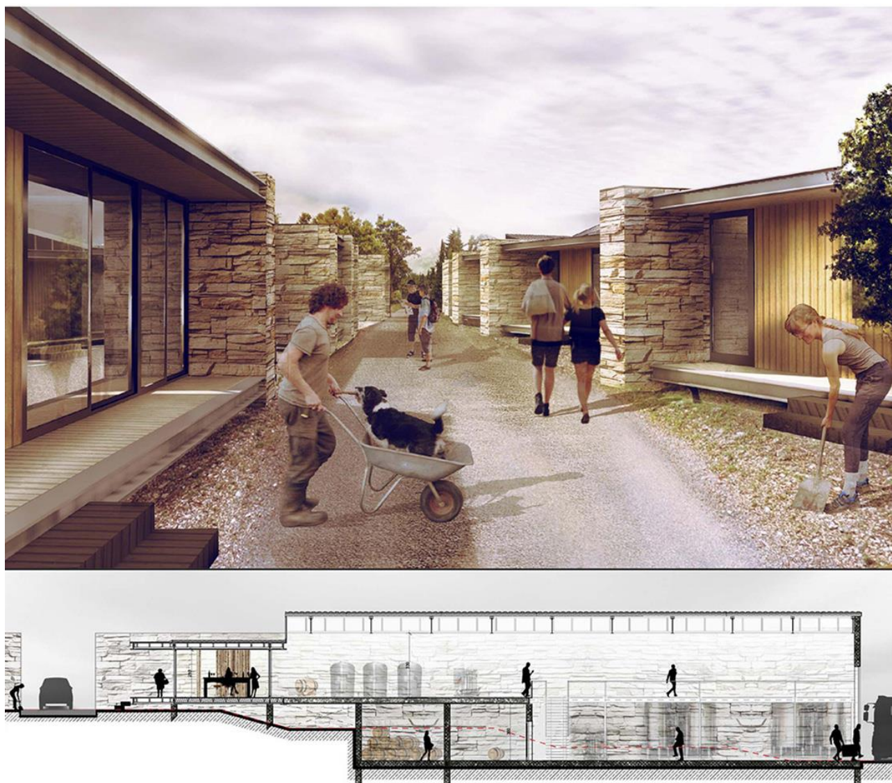
Figure 5 : Projet « la vignette », cave collaborative à Montpeyroux, 2016.

d'expérimentation : un tiers entre les membres du groupe d'agriculteurs, entre ce groupe et la commune, et entre ce groupe et l'INRA porteur de la recherche. Les approches thématiques ont permis d'élargir le champ de réflexion à partir des projets et d'y engager les acteurs. Parmi ces thèmes, en référence à la figure de la cave coopérative, la question du rapport entre individuel et collectif a été envisagée et mise en questionnement. Sur la base de dispositifs architecturaux prospectifs, c'est la structuration d'une profession qui est interrogée, notamment à travers des propositions de nouvelles formes de collaboration : de la cave coopérative à la cave collaborative.