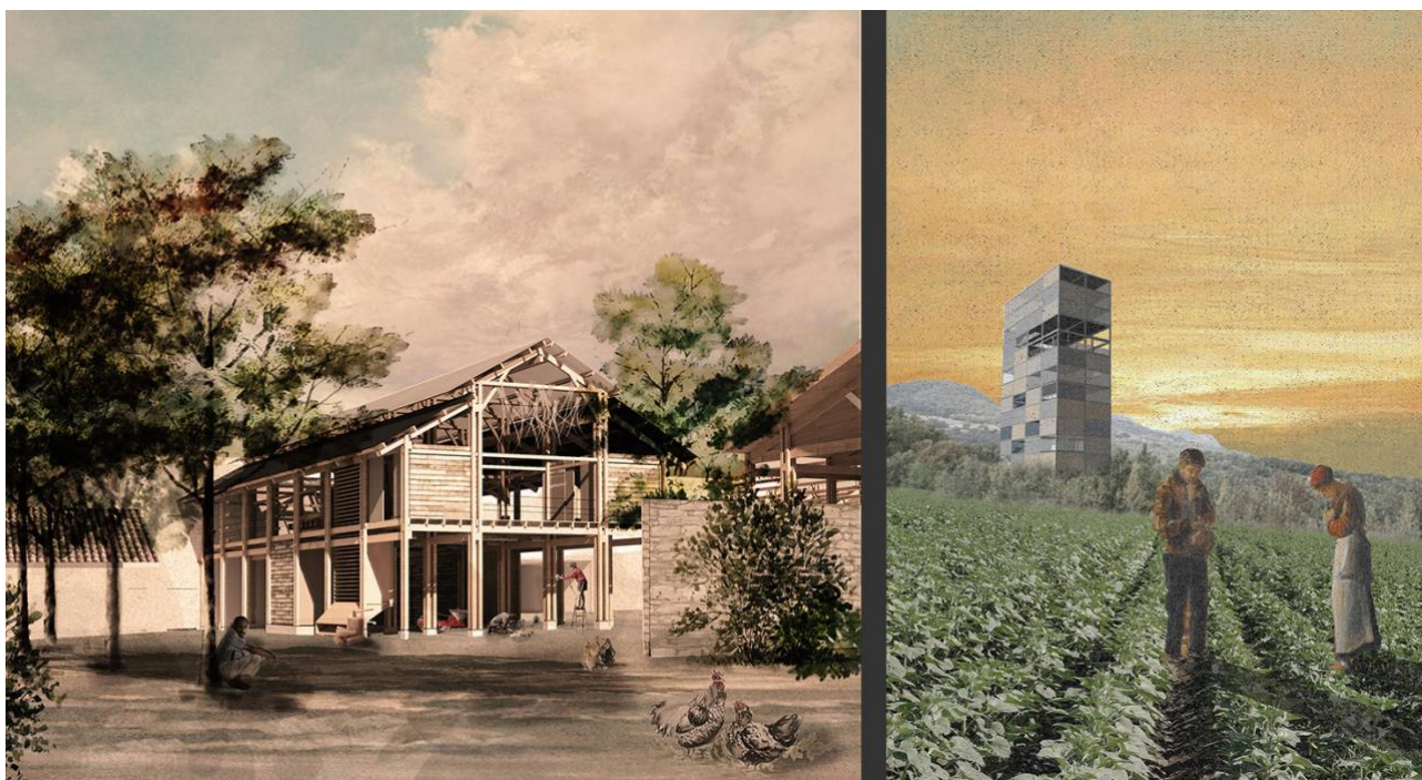
Figure 2 : Images fertiles pour les projets du mas de Mirabeau (2018) et de Montpeyroux (2016).

Master M2 - Domaine d'études Situation-s à l'ENSA Montpellier.