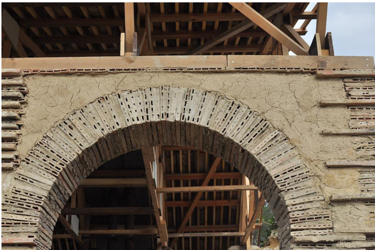
Figure 8 : Détail du pavillon en ré-emploi, mas de Mirabeau, Fabrègues (34), 2018.

imaginaire technique et matériel et imaginaire social et politique et invite à mobiliser la pensée utopique en l'ancrant dans le processus d'une situation.