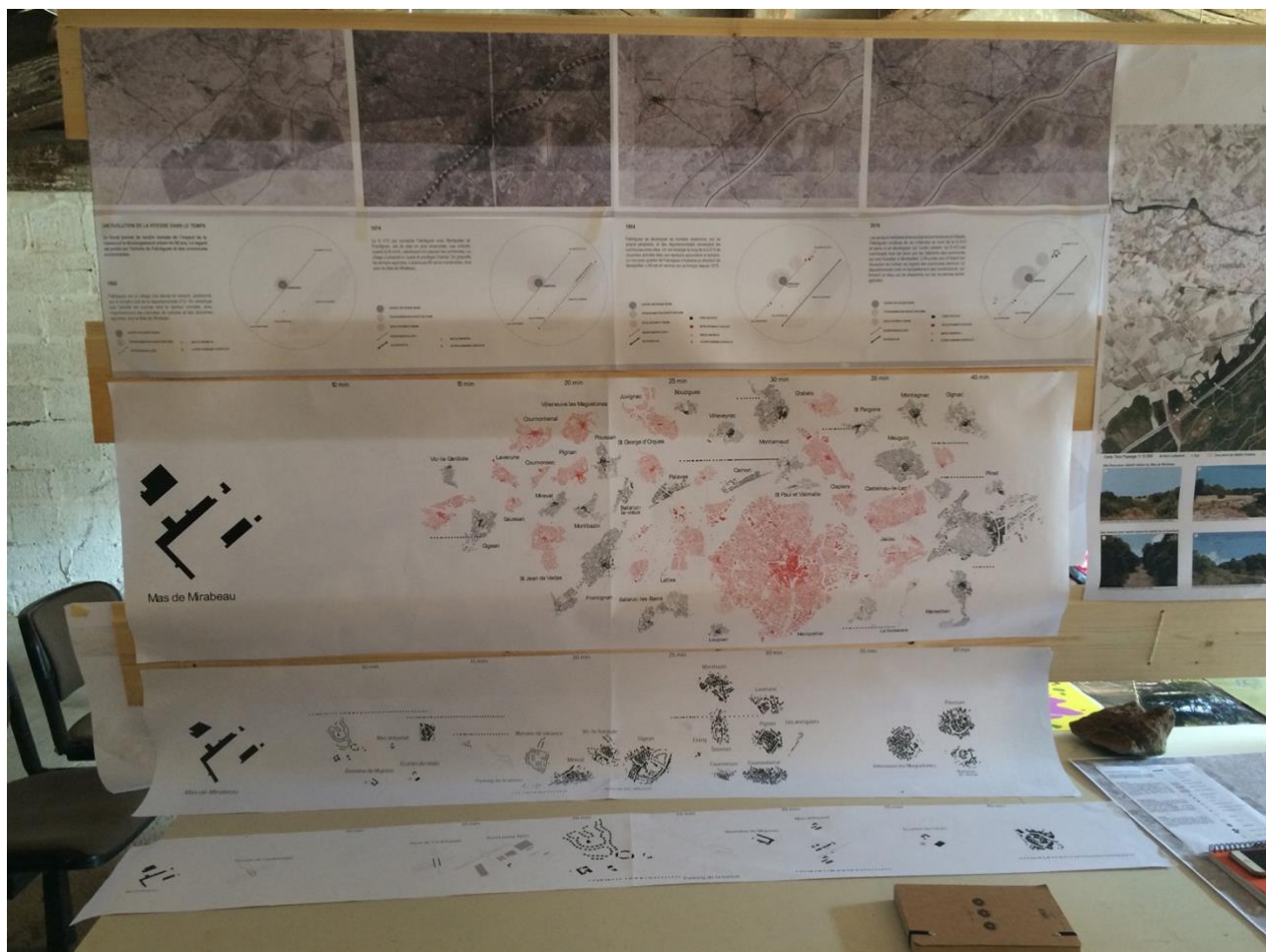
Figure 1 : Restitution de l'approche cartographique du territoire, Fabrègues (34).

Suite à cet ancrage commun sur la question pédagogique en école d'architecture, et à travers des rencontres et des préoccupations propres, un certain nombre de thématiques ou objets d'étude guident les approches de projets. Ainsi, le territoire rural ou péri-urbain, envisagé notamment à travers les mutations agricoles ou la désertification des centre-bourgs, est devenu le support des projets étudiants sur les quatre années passées. Cette orientation est aussi un positionnement par rapport au phénomène de métropolisation. Ainsi, les thématiques de re-territorialisation (avec notamment des affinités pour le mouvement des Territorialistes), de pratiques émergentes et d'économie faible, irriguent notre enseignement.