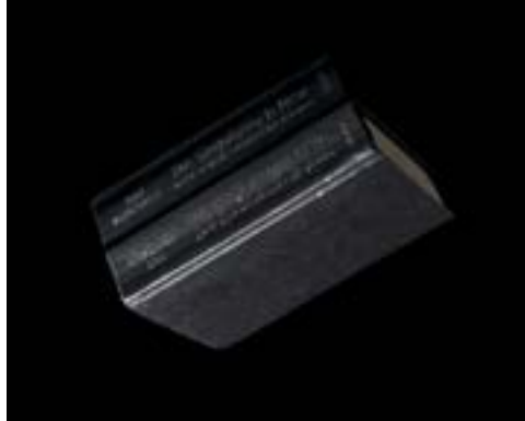
Figure 1 : Ray Kurzweil.

H+ (2015-2018), http://www.gafsou.ch/hplus .