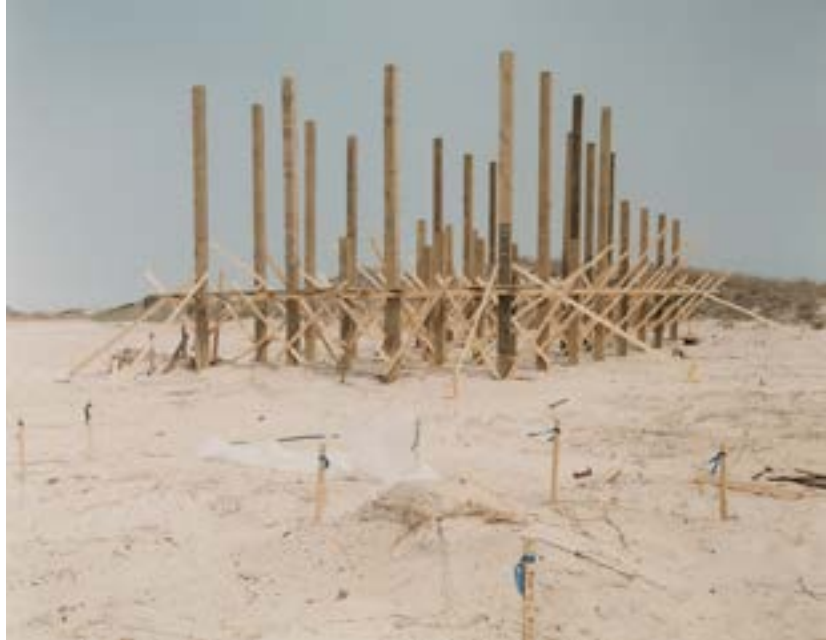
Figure 3 : Public Beach Structure.

Photographie issue du livre Humanature de Peter Goin, 1996 https://www.petergoin.com/human-nature .