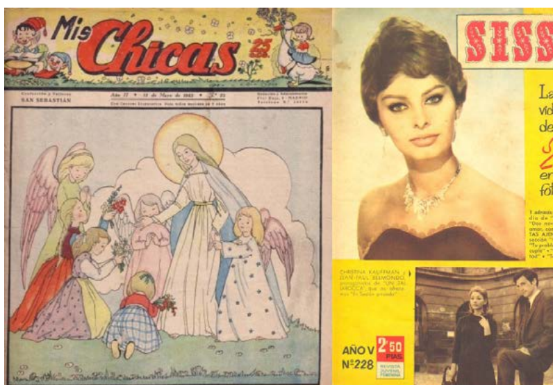
Illustration 1. À gauche, couverture de Mis chicas n° 52 (1942), à droite, Sissi n° 228 (1962).