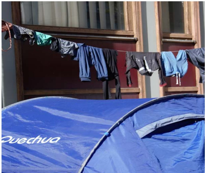
Figure 2 : Campement Gergovia, Université Clermont Auvergne, 2017.

C'est bien tout d'abord la précarité qui caractérise le campement, en opposition à la sécurité et la stabilité qu'offre habituellement l'habitat. Historiquement, le campement a toujours été « un logement a minima », dans lequel il s'est agi de « s'abriter et dormir "sur le champ" (à l'origine du terme "camp") et aux deux sens du terme, immédiat et sommaire 11 ». Le campement contemporain, dans la lignée de son sens étymologique, est moins un habitat qu'un simple refuge qui se trouve, un abri qui s'aménage.