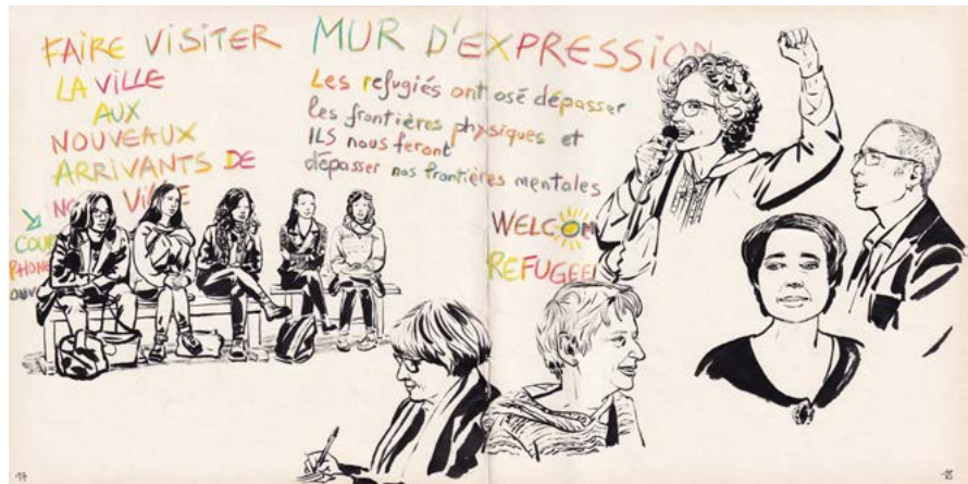
Figure 9 : Campement Gergovia, Université Clermont Auvergne, 2017.

Assis, en cercle, les uns derrière les autres, Sur des bancs, Ou debout, Ils partagent, discutent et échangent. Ils donnent et reçoivent 59 .