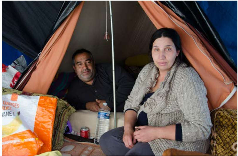
Figure 4 : Campement Gergovia, Université Clermont Auvergne, 2017.

« habiter dehors » : la recréation d'un intérieur en extérieur, le vécu d'une intimité exposée. Le coffret Réfugier [Carnets d'un campement urbain] 14 rend compte d'une telle exposition, en témoignant de l'installation, en octobre 2017, d'un campement de fortune par des familles et des jeunes migrants à « Gergovia », à la faculté des lettres de l'université de Clermont-Ferrand. Les vitres de la bibliothèque universitaire donnaient directement sur les tentes du campement. Un quotidien presque ordinaire se déroule donc dans un habitat extraordinaire.