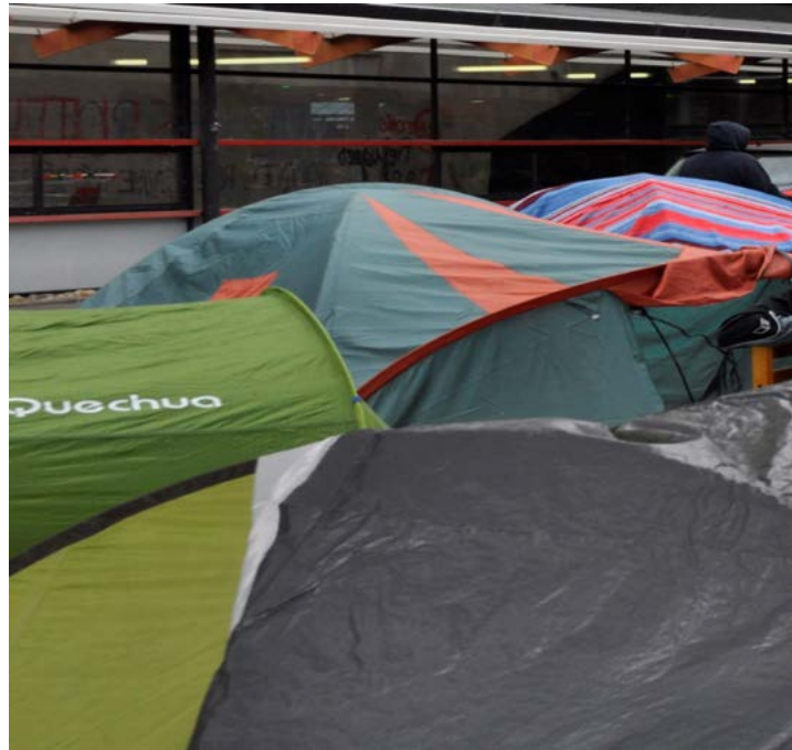
Figure 3 : Campement Gergovia, Université Clermont Auvergne, 2017.

et du migrant 12 . » La précarité tient à la vulnérabilité de l'installation, aménagée en urgence et dans l'improvisation, ainsi qu'aux conditions météorologiques, aux risques sanitaires, à l'insécurité également. Les formes du refuge et de l'abri qui sont celles du campement – comparables à celles du squat – inscrivent par conséquent l'habiter dans la fragilité. Dans une certaine mesure seulement – car les conditions du campement demeurent ici très spécifiques –, la précarité du campement s'apparente à celle de la halte en voyage, moment et lieu de transition, de transit : le lieu de l'étape n'est ordinairement pas choisi ou pas forcément choisi, il est parfois imposé et peut être « un lieu de résidence forcé et contraint 13 », à grande distance du topos de la retraite volontaire et féconde. Évidemment, la précarité est plus grande encore dans le campement. Les étapes imposées se répètent à plusieurs moments de l'itinéraire des personnes exilées, la survie prévaut pour certaines d'entre elles à toute autre considération. Vivre une étape de ce déplacement ne consiste pas à renoncer provisoirement à un confort que l'on sait retrouver ensuite, mais s'apparente souvent à un sacrifice sans retour.