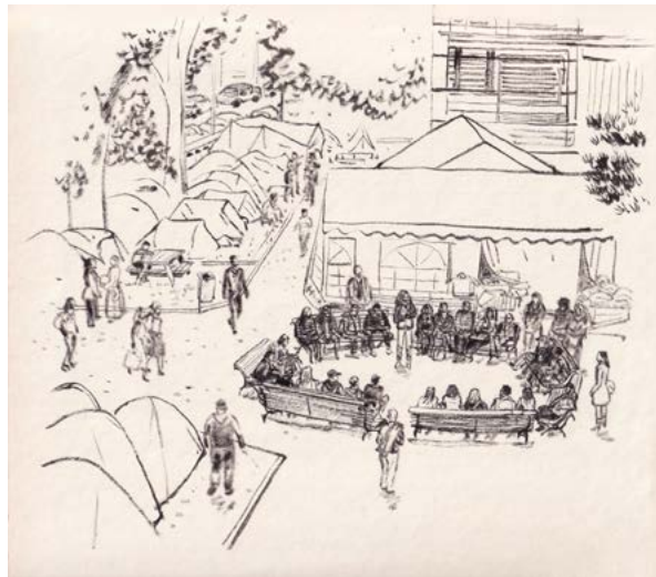
Figure 7 : Campement Gergovia, Université Clermont Auvergne, 2017.

Le campement apparaît par conséquent comme un laboratoire de l'habiter. D'une part parce que, par-delà son caractère très sommaire, il révèle des formes de créativité : il s'aménage et s'organise en quelques jours, témoignant de l'inventivité et de l'obstination humaines. L'anthropologue Alexandra Galitzine-Loumpet parle même « des stratégies contre la précarité et des arts de faire du campement » – qui s'élaborent « au fil des expériences migratoires, des coprésences entre bénévoles, militants et exilés 47 ». Et Guy Amsellem évoque « l'ambivalence du campement, [...] son inventivité spatiale, [le] potentiel de renouvellement qu'il porte 48 ».