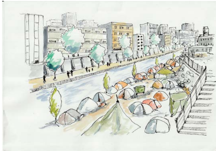
Figure 1 : Réfugier [Carnet d'un campement urbain]

Malgré nos enclos, nos Babels, nos ravages, quelque part la parole converge et nous relie. Andrée Chedid, Fraternité de la parole .