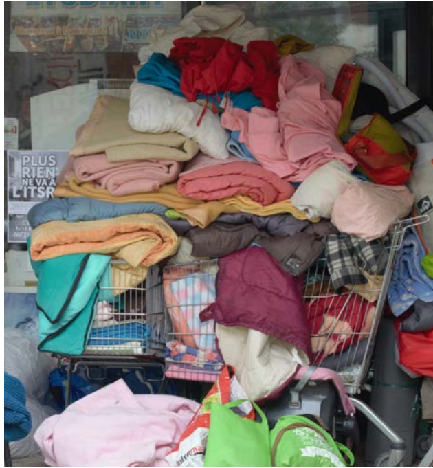
Figure 5 : Campement Gergovia, Université Clermont Auvergne, 2017.

Liée au paradoxe de l'intimité exposée, la promiscuité s'exhibe dans les descriptions littéraires du campement. Patrick Chamoiseau, mêlant les symboliques de l'étape et de la traversée, évoque ainsi « tout un lot d'origines [qui] se retrouvent brouillées dans un radeau de baluchons et de valises 18 ».