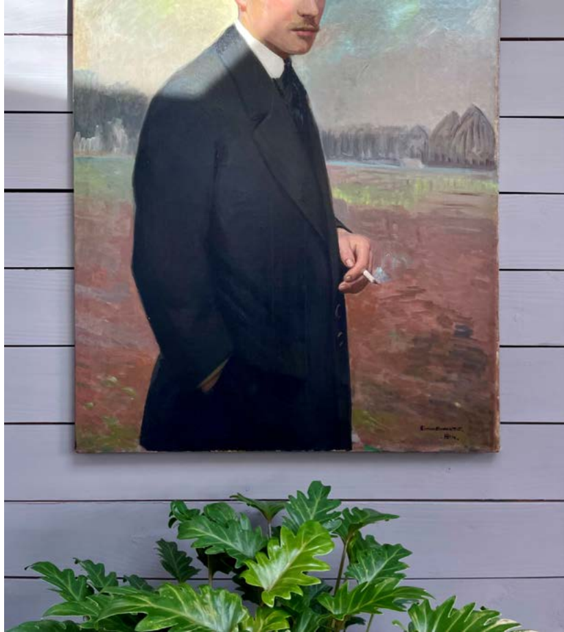
Simon Monnatte, Portrait d'un jeune homme aux yeux bleus fumant une cigarette , 1914.